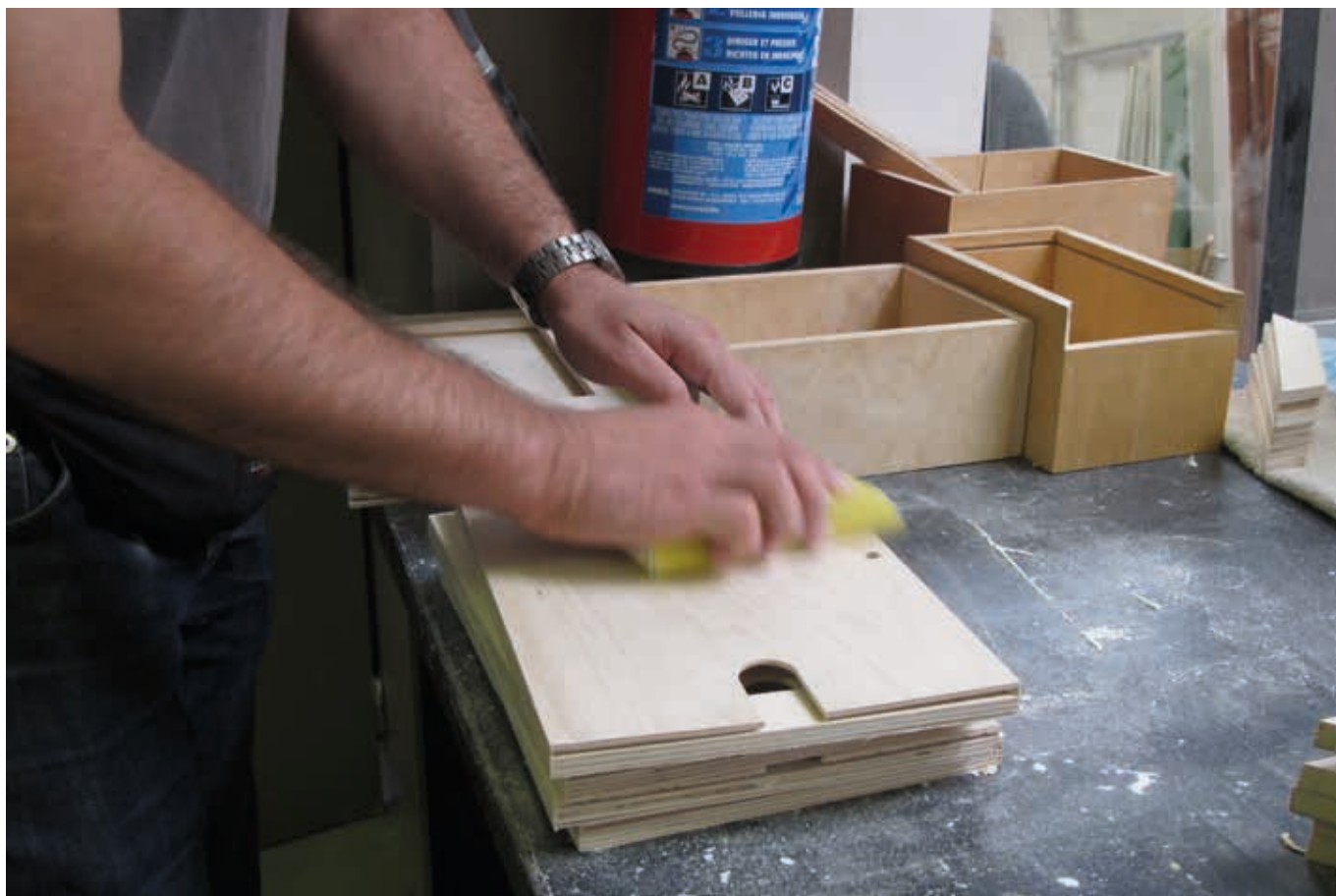
Sociale economie: kansen voor mensen met een afstand tot de arbeidsmarkt.